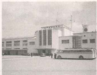
Gare Marítima de Alcântara c. 1952