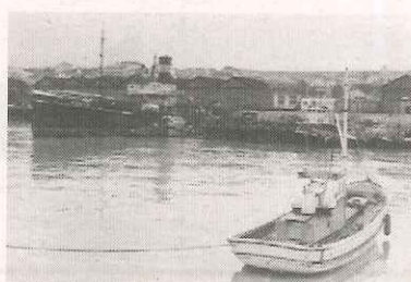
Doca de Santo Amaro anos 60